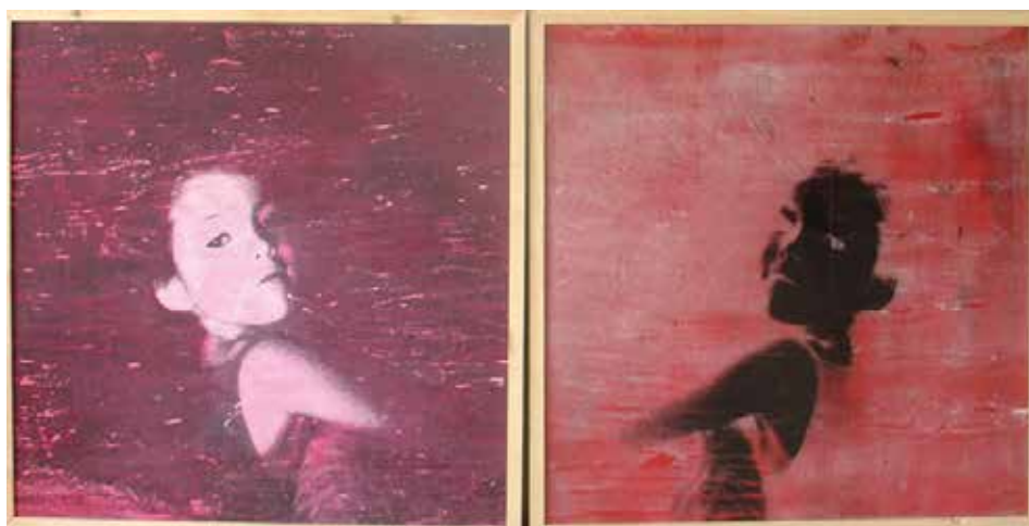
POSITIU- NEGATIU. Acrilic sobre taula 93 x 190 cm.