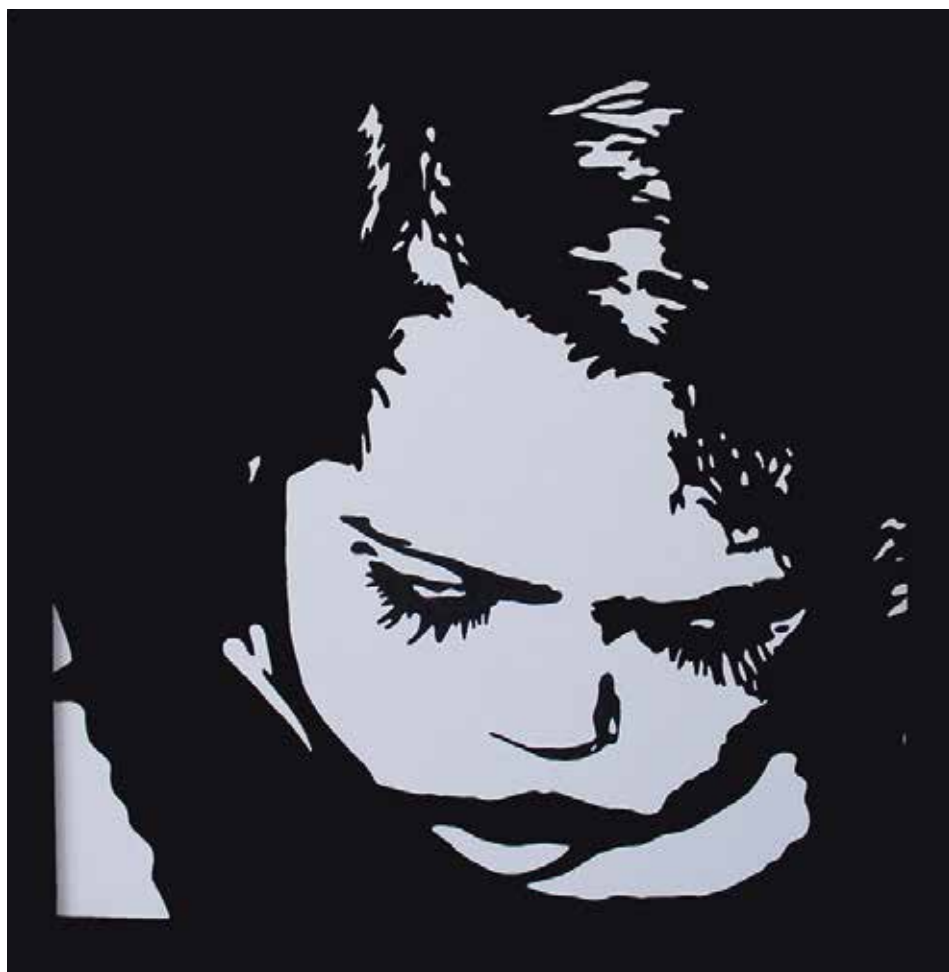
ALBA. Acrílic sobre llenç 66 x 66 cm.