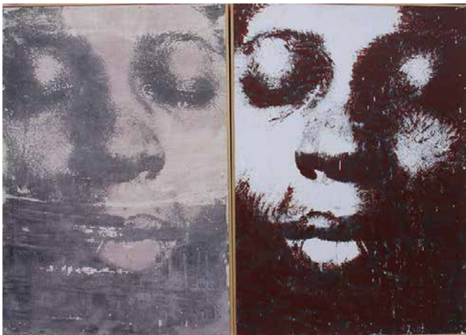
ROSTRES. Acrílic sobre taula 100 x 162 cm.