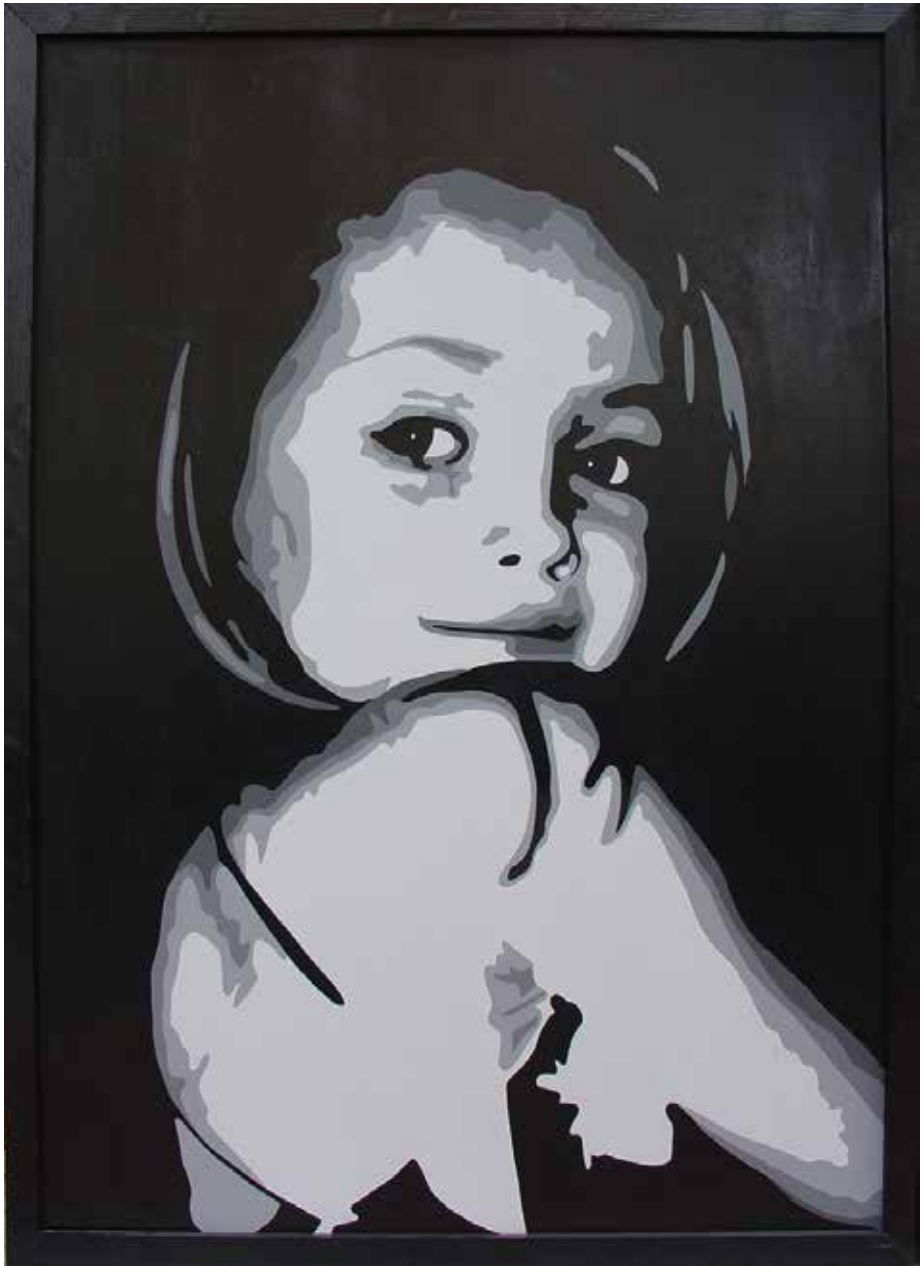
AIDA. Acrílic sobre llenç 154 x 112 cm.