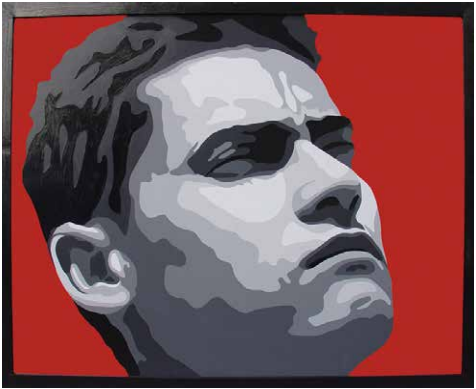
SERGIO. Acrílic sobre llenç 105 x 131 cm.