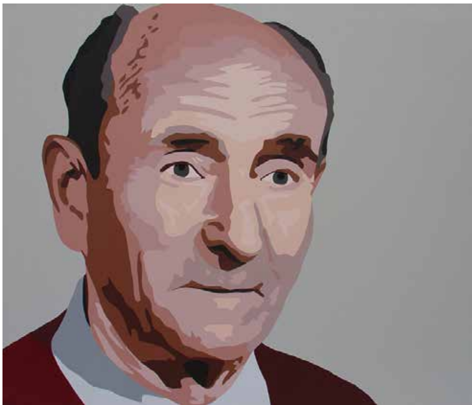
ELS QUE JA NO ESTAN. Acrílic sobre llenç 80 x 92 cm.