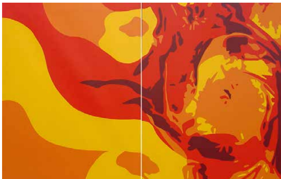
MOMENTS D'ALTERACIÓ. Acrílic sobre llenç 117 x 184 cm.