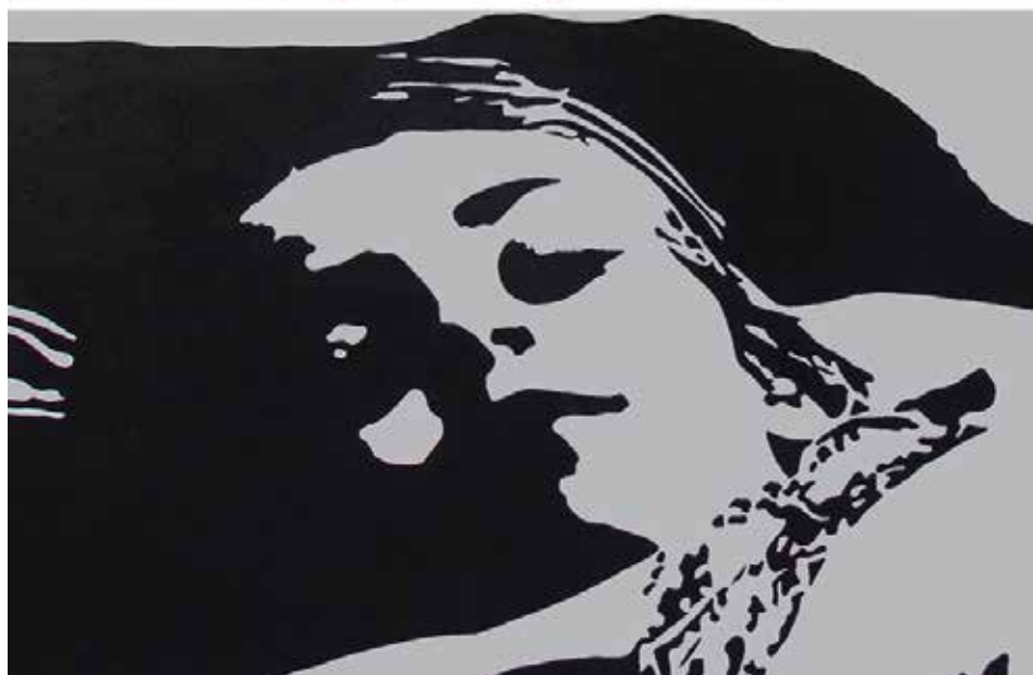
DESCANS. Acrílic sobre llenç 160 x 120 cm.