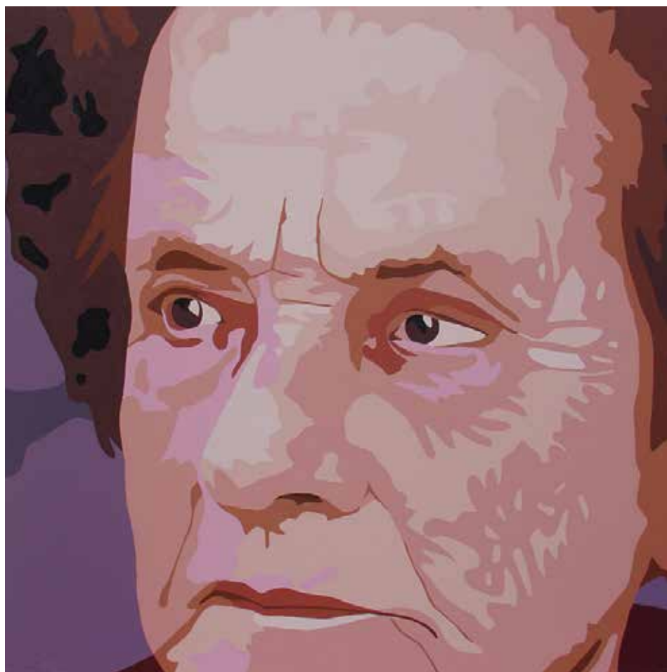
AVIA. Acrílico sobre llenç 61 x 61 cm.