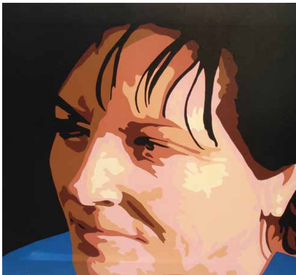
TERE. Acrílico sobre llenç. 80 x 92 cm.