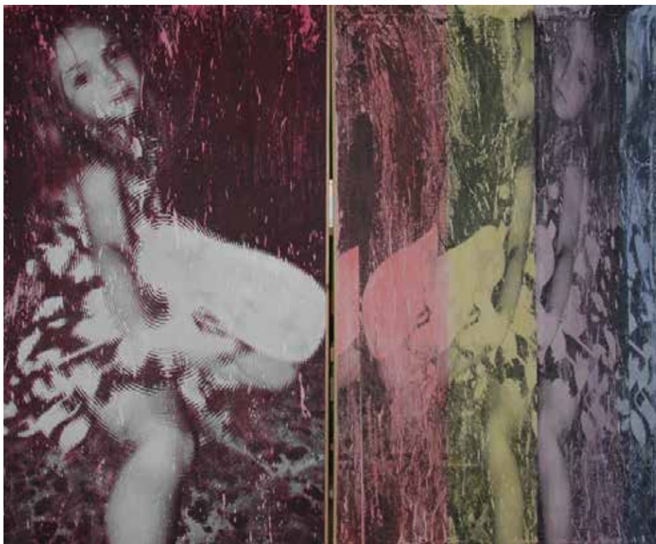
DISTORSIONS. Acrílic sobre taula y lienzo 136 x 166 cm.