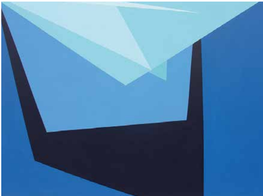
MOMENTS DE SERENITAT. Acrílic sobre llenç 95 x 130 cm. MOMENTS MELANCÒLICS. Acrílic sobre llenç 95 x 130 cm.