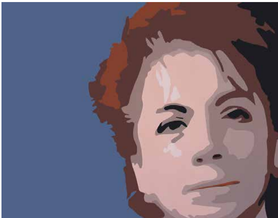
CARMEN. Acrílic sobre llenç 85 x 110 cm.