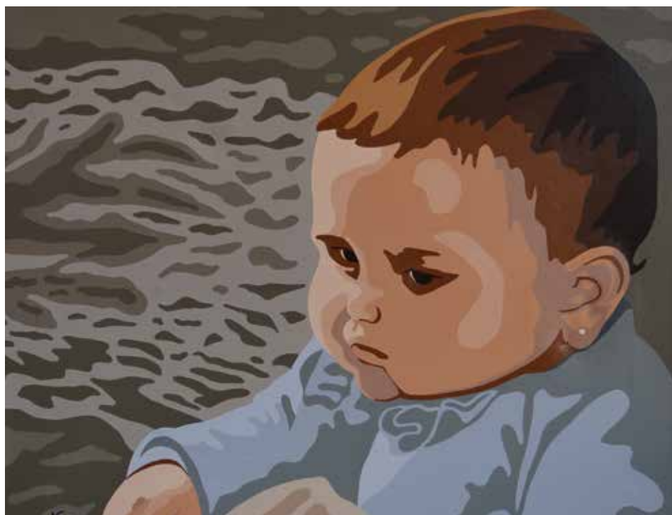
LETI. Acrílico sobre llenç. 50 x 60cm.