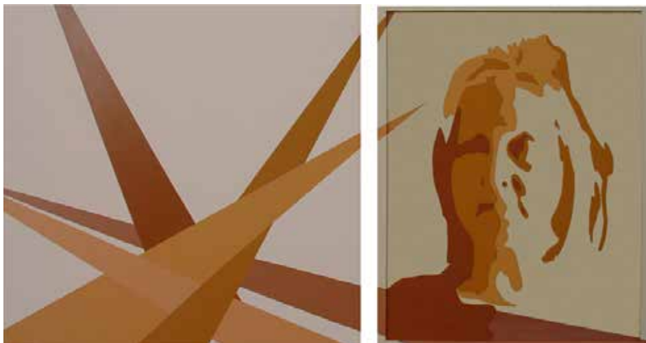
A MIG CAMÍ II. Acrílic sobre llenç 120 x 229 cm.