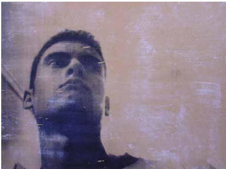
ARRIBADA A LA MADURESA. Acrílic sobre taula 87 x 119 cm.