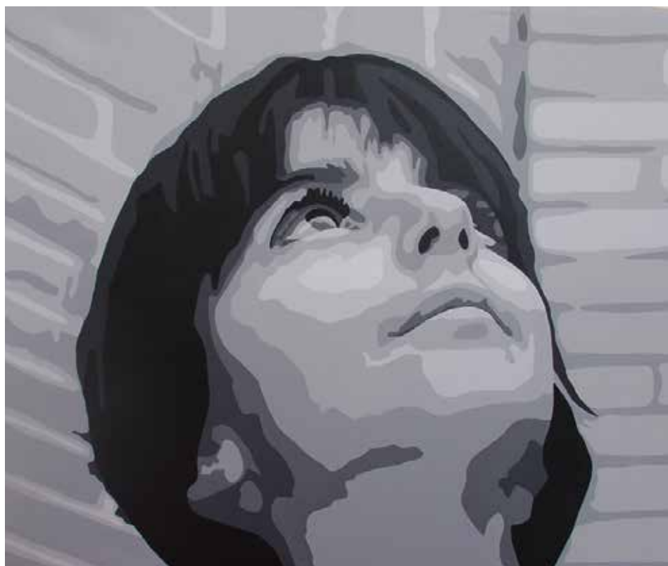
SARAY. Acrílic sobre llenç 108 x 130 cm.