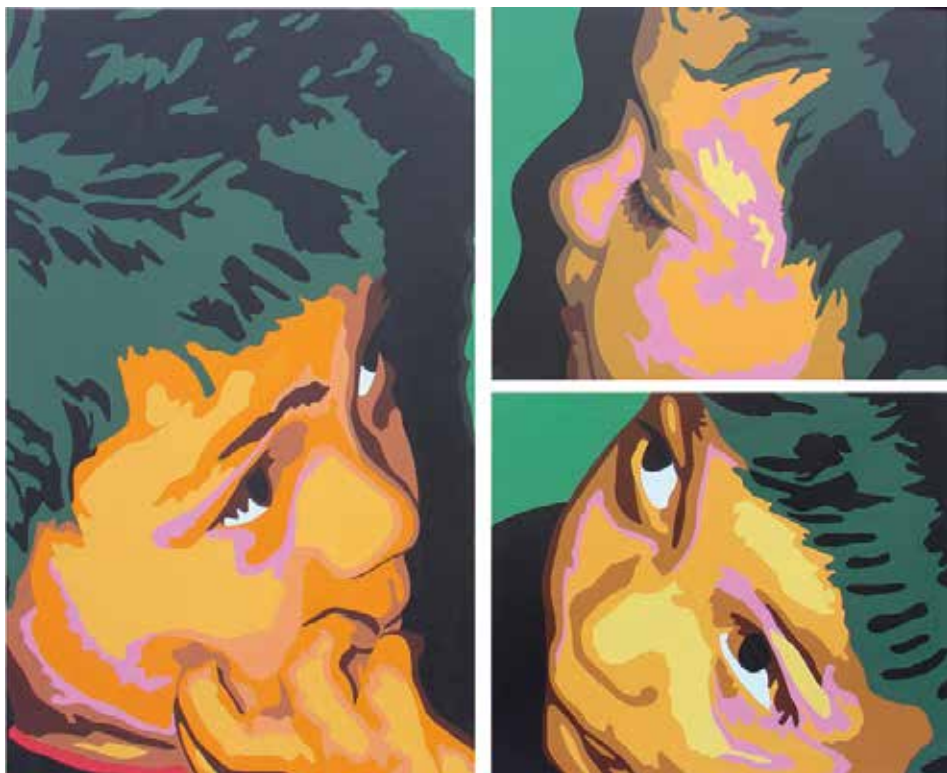
MIRADES II. Acrílic sobre llenç 133 x 167 cm.