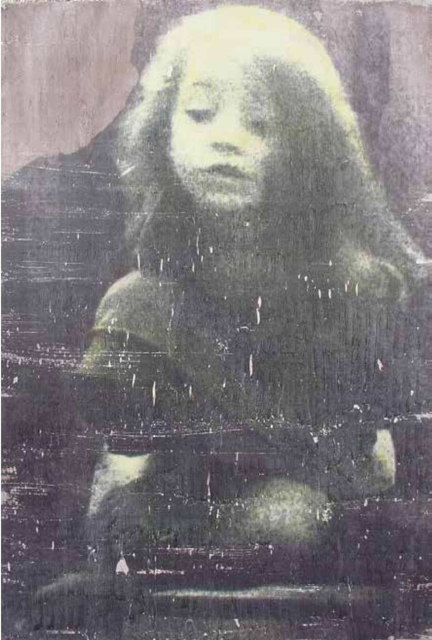
INOCÈNCIA. Acrílic sobre taula 130 x 87 cm.