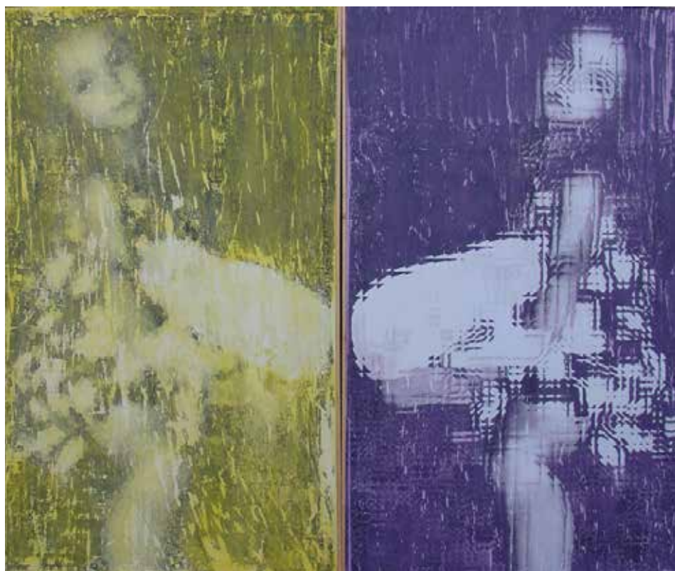
DISTORSIONS II. Acrílic sobre taula y lienzo 136 x 166 cm.