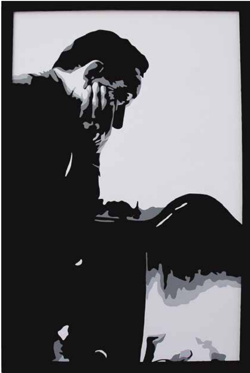
ELS QUE JA NO ESTAN II. Acrílic sobre llenç 135 x 87 cm.