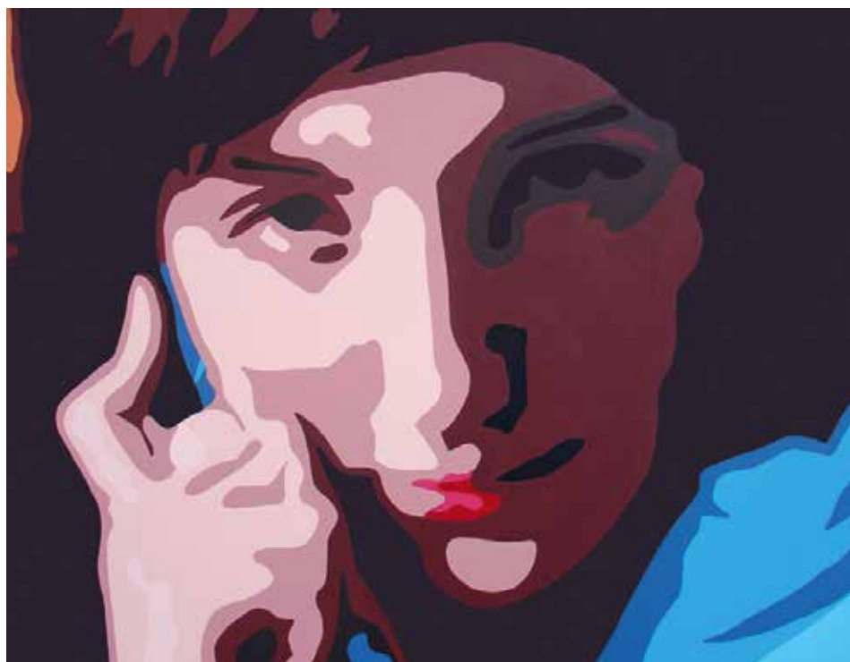
ADOLESCÈNCIA. Acrílic sobre llenç 70 x 90 cm.